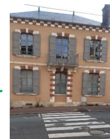
Cabinet médical la Cybèle Avenue de la République