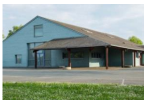
Salle des fêtes Route de l'étang