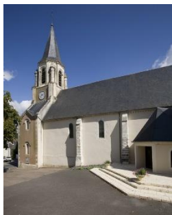
Eglise Rue de l'église