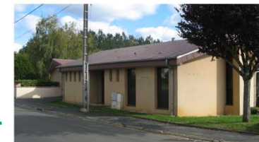
Salle polyvalente 17 route de Saint Palais