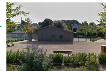
Accueil périscolaire 12 impasse de la Vallée