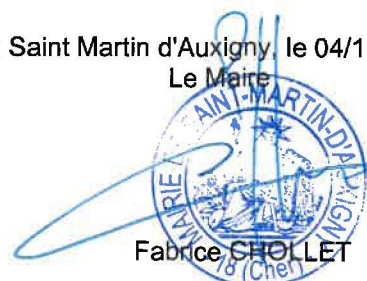
Fabrice CHOLLET /s/ (Cher)